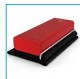
Red EAN: 854894005036