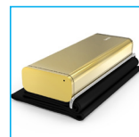
Gold EAN: 854894005067