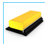
Racing Yellow EAN: 854894005012