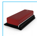
Imperial Red EAN: 854894005043