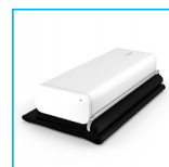
Muse - Weiss EAN: 854894005005